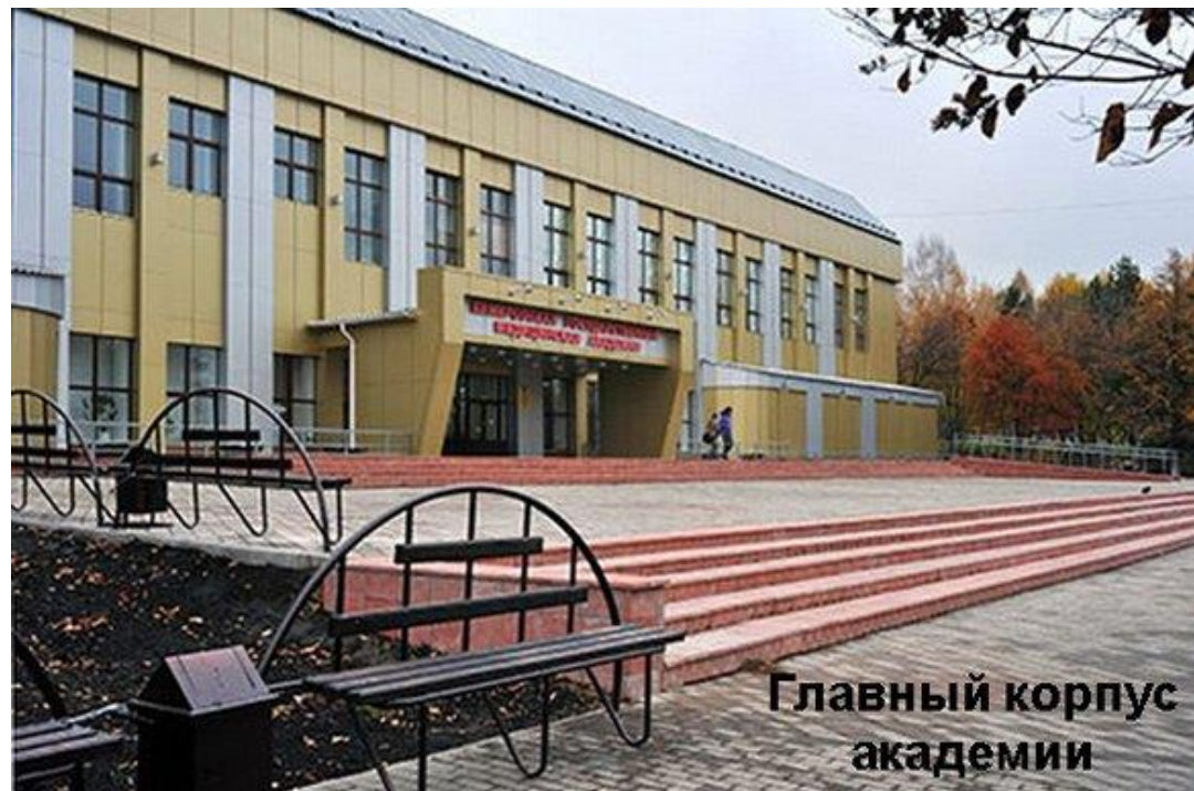
Главный корпус академии